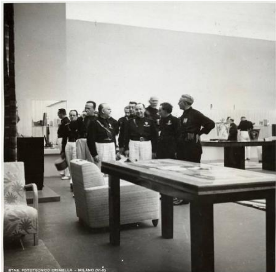
ITAL. FOTOTECONCO CRIMELLA - MILANO (VI-5)