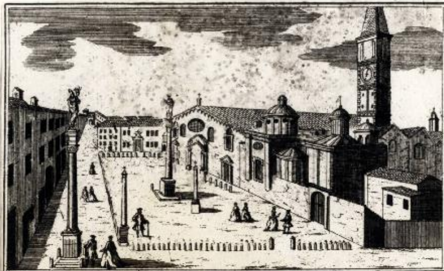
S. Custodio P. Fri. Dominicani. P. T.