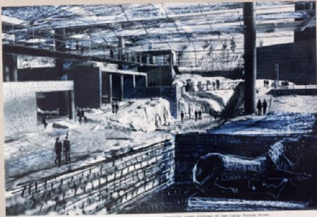
Fig. 10. The interior of the factory. The structure is made of concrete and steel. The floor is made of concrete and steel. The structure is made of concrete and steel.