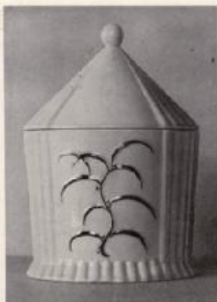
DAGOBERT PICHE - WIEN. - DOSE IN KERAMIK MIT GOLD.