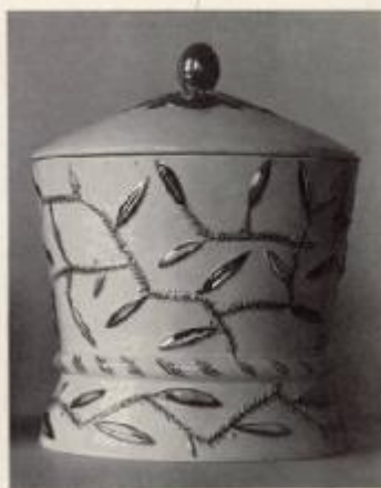
DAGOBERT PICHE - WIEN. - DOSE - KERAMIK MIT GOLD.