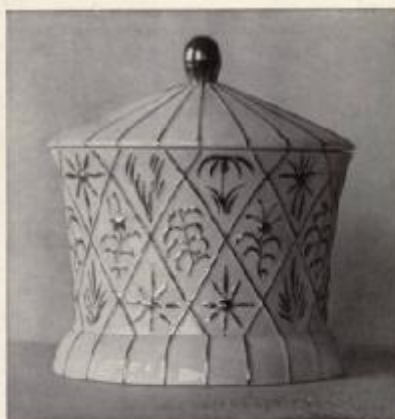
DAGOBERT PICHE - DOSE - KERAMIK. WIENER WERKSTÄTTE.