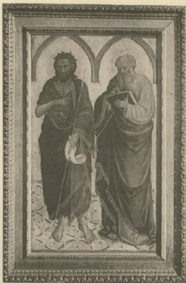
N. 175. SPINELLO — dit ARETIN Saint Jean Baptiste et Saint Jean l'Evangeliste