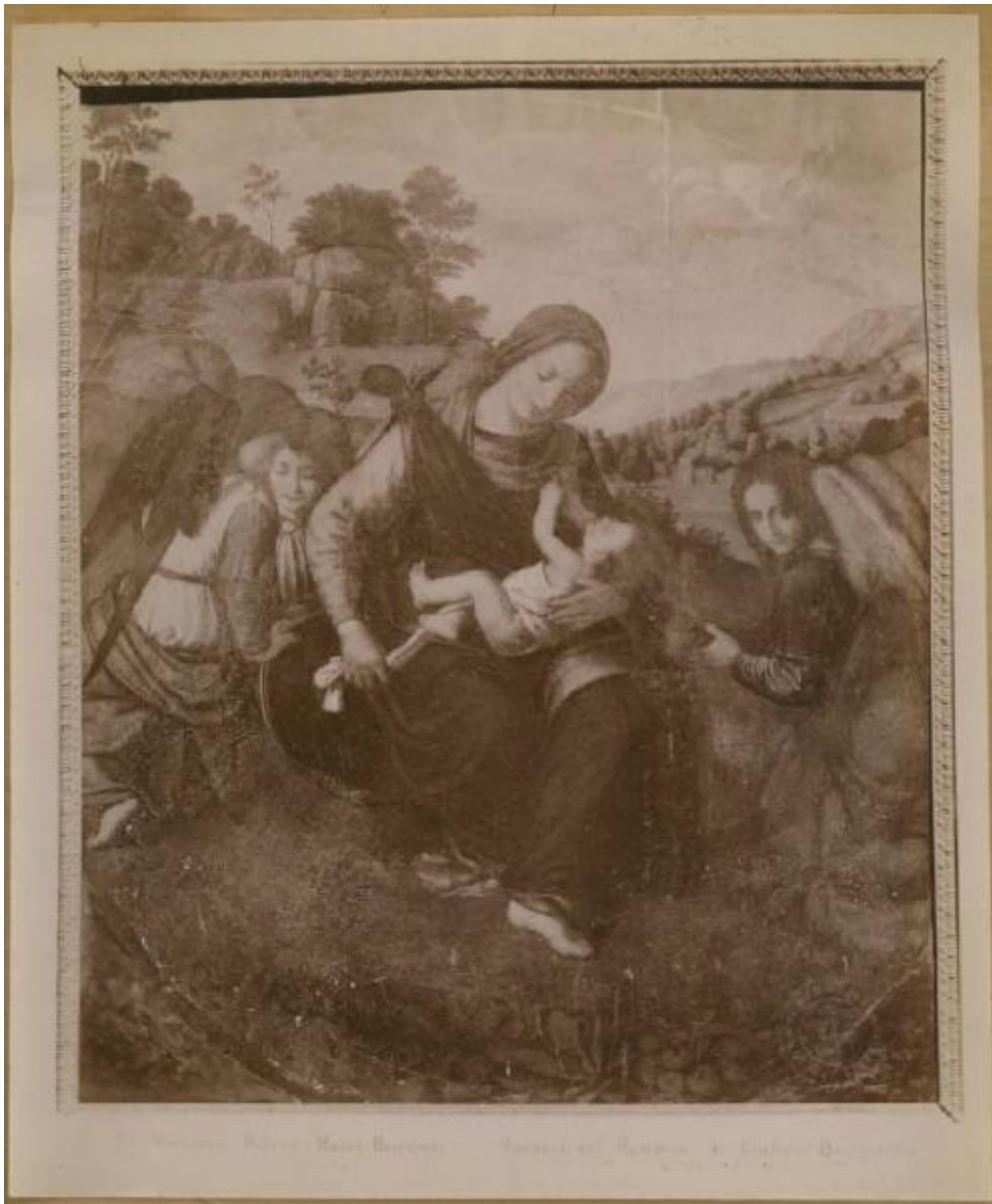
Madonna Lattante. - Madonna del Latte. - Madonna del Bambino. - Madonna del Bambino. - Madonna del Bambino.