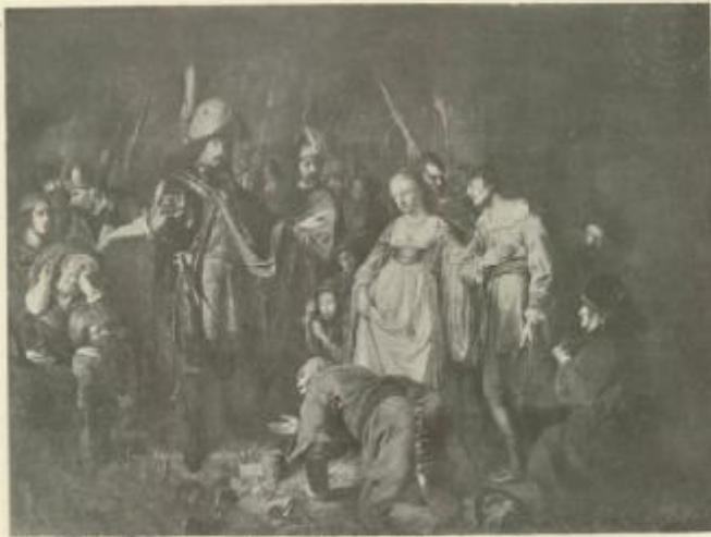
00 THE CHARITY OF NEMO. LOUIS-FERDINAND-REYER, BERLIN