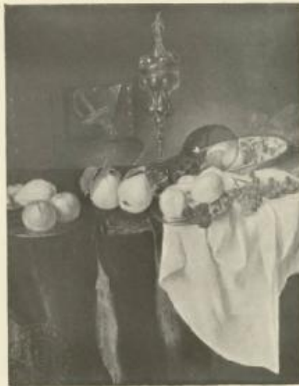
00 STILL LIFE. KATHER-FRIEDRICH-MESSELM, BIELEN