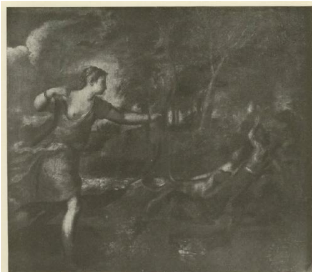
DIANA AND ACTEON, BY TITIAN, COLLECTION OF THE EARL BROWNLOW

EXHIBITION OF OLD MASTERS AT THE GRAFTON GALLERIES—II PLATE II