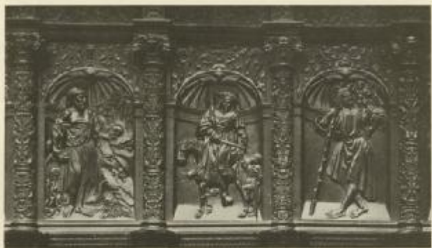
(E) S. JEROME, S. MARTIN AND S. CHRISTOPHER, DETAIL ABOVE THE SPATS ON THE EPITAPH OF THE CHOR, SANTA DOMINGO DE LA CALANCA, BY ANDRÉS DE NÁJERA.