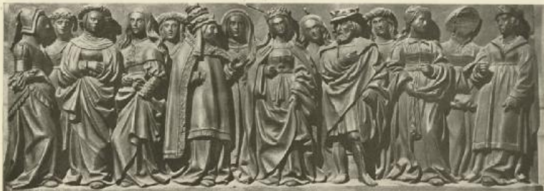
(C) DETAIL (SUPPOSED TO COME FROM THE CHOIR-STALLS OF SAN BENITO EL REAL) WHICH CANNOT BE ASSIGNED WITH ANY CERTAINTY TO ANDRÉS DE NÁJERA. NOW IN THE MUSEUM, VALLADOLID.