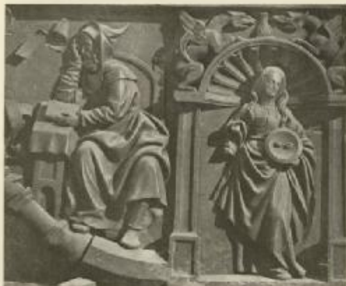
(D) A PROPHET AND S. LUCIA, FROM THE CHOIR-STALLS OF SAN BENITO EL REAL, BY ANDRÉS DE NÁJERA. NOW IN THE MUSEUM, VALLADOLID.