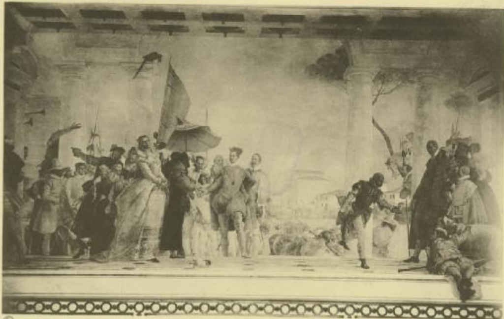
Reception de Henri III à Venise Peint par TIZIANO (Musée Lapidarium - Louvre)