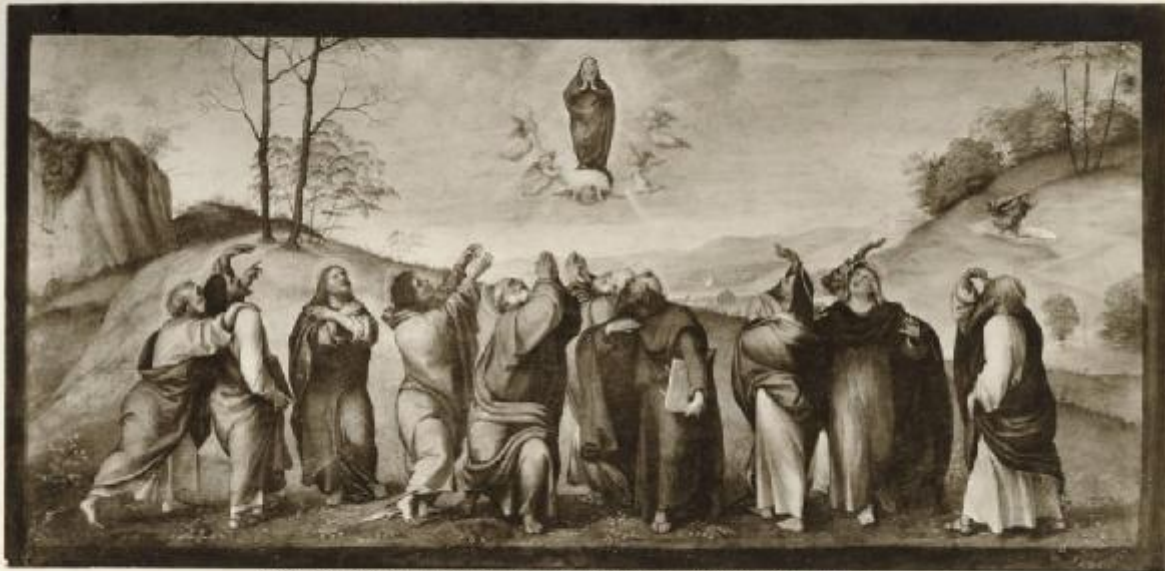
17699 - MILANO - Assunzione - Lorenzo Lotto - Galleria Brera - Anticassi, Roma