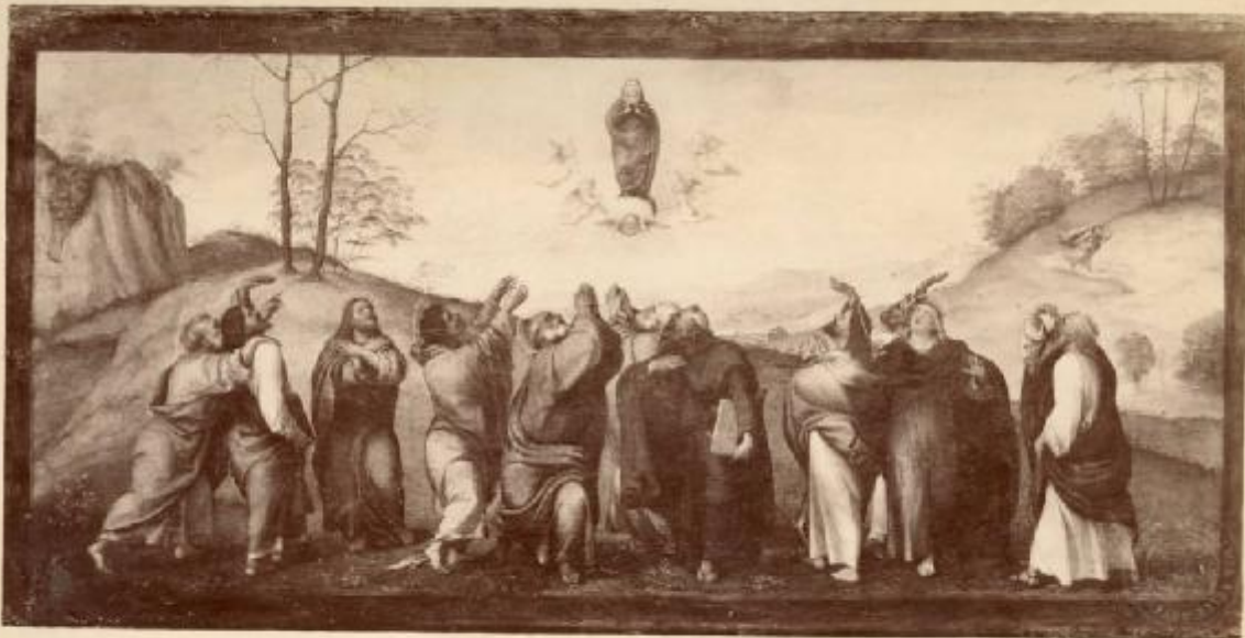
(Ed.ª Brogi) 14508, MILANO - Pinacoteca di Brera - L'Assunzione della Vergine e gli Apostoli; Lorenzo Lotto.