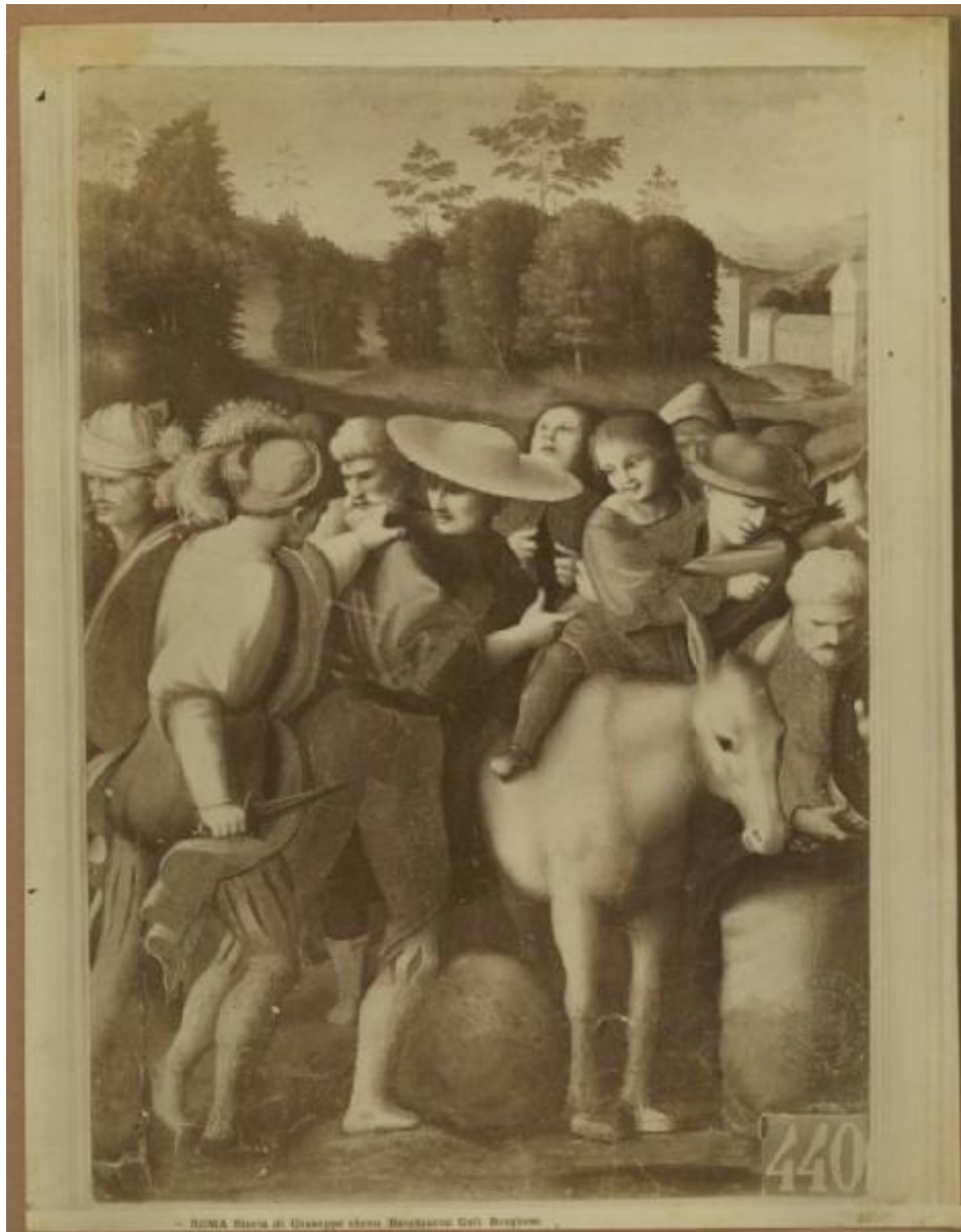
— ROMA. Storia di Giuseppe e Maria. Bambinaccio del Reptone.