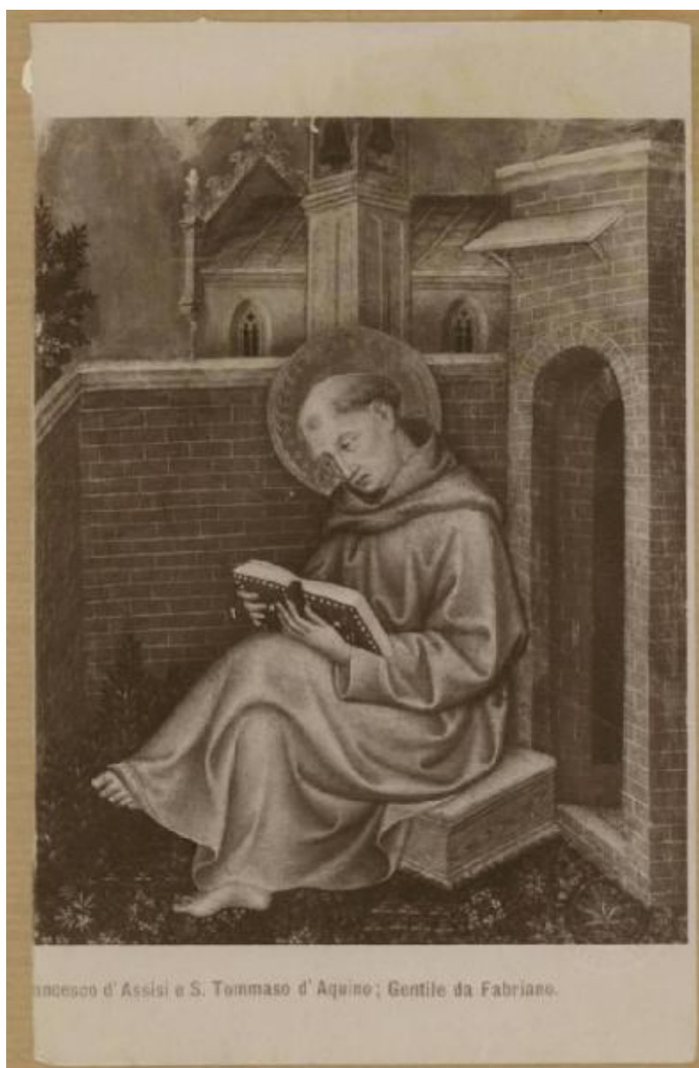
Francesco d'Assisi e S. Tommaso d'Aquino; Gentile da Fabriano.