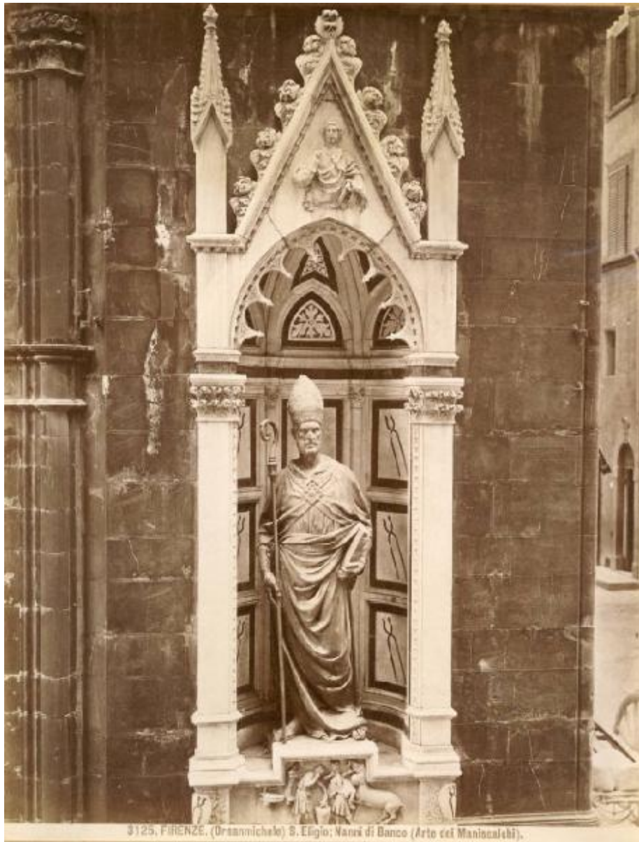
3125. FIRENZE. (Orsannichele) S. Efigio; Nanni di Banco (Arte dei Manicofebi).