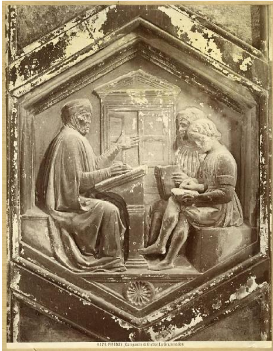
4179. FIRENZE - Campanile di Giotto: La Grammatica.

Link risorsa: https://www.lombardiabeniculturali.it/fotografie/schede/IMM-4t060-0002534/