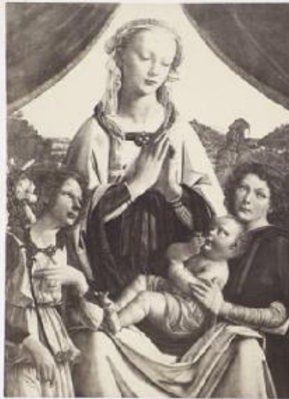
THE VIRGIN ADORING THE INFANT CHRIST.