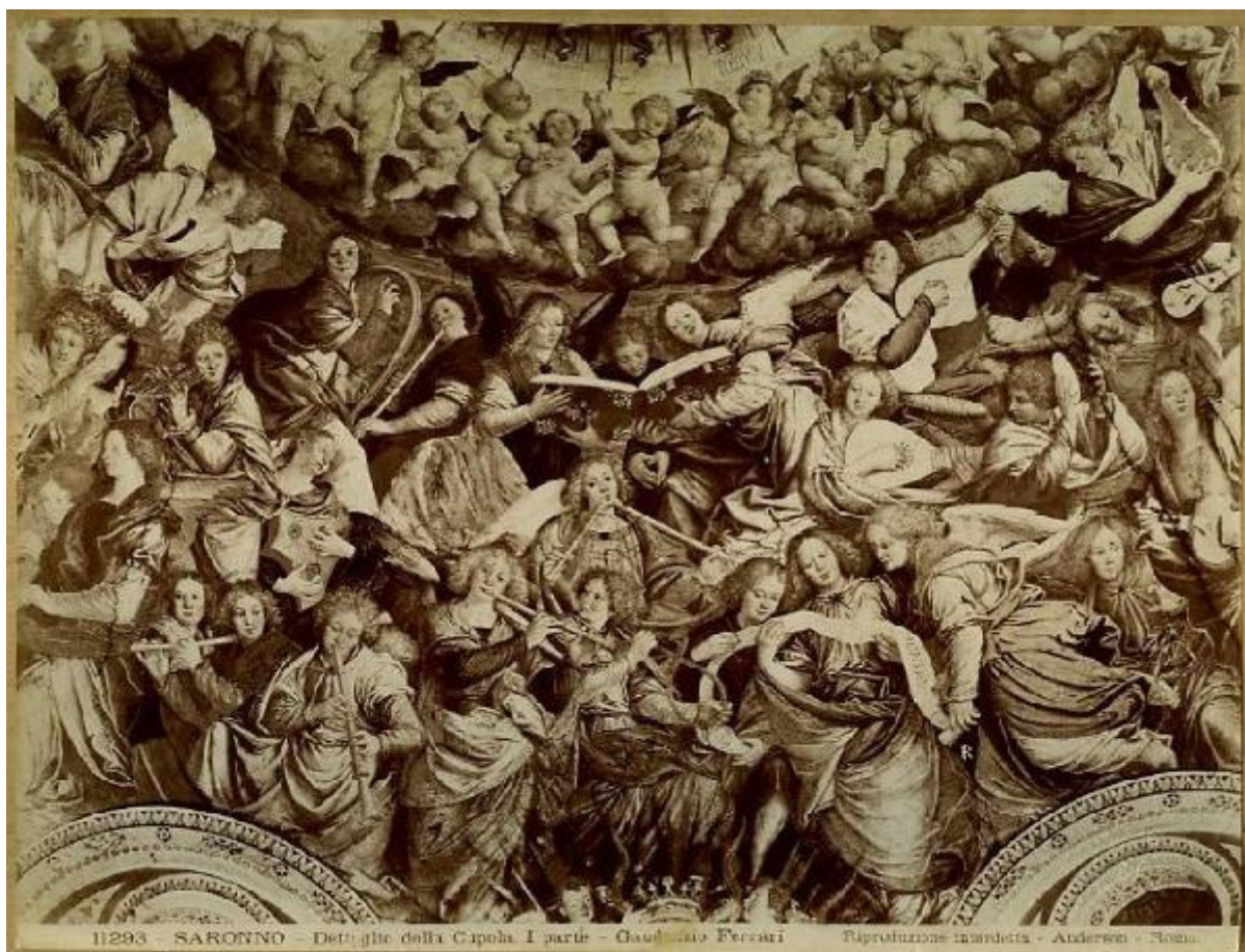
11293 - SARONNO - Detti gli della Cupola. I parte - Gaetano Ferrari - Riproduzione inaradata - Anderson - Roma.