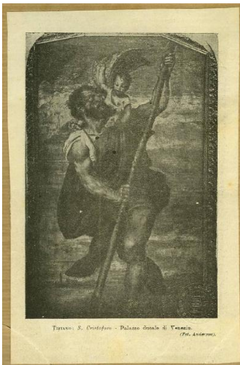
TRIANO: S. Cristoforo - Palazzo ducale di Venezia. (Ed. Anselmi).