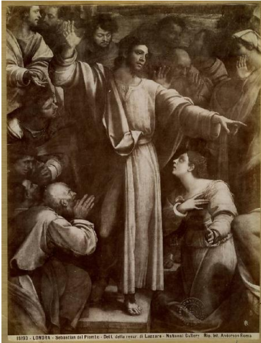
18193 - LONDRA - Sebastian del Piombo - Detl. della resur. di Lazzaro - National Gallery