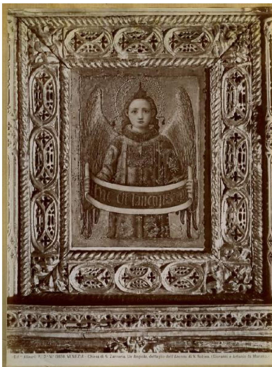
Ed. - Alinari, P., 2° N° 13858. VENEZIA - Chiesa di S. Zaccaria. Da Angiolo, dell'Ancona di S. Sabina. (Giorgio e Antonio de Marzani).