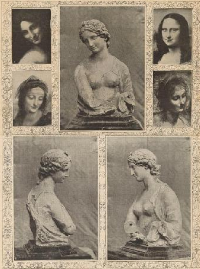
PLATE I. THE WAX BUST ATTRIBUTED TO LEONARDO DA VINCI. PLATE II. MONA LISA. THE ORIGINAL PAINTING ON WOOD, SAID TO BE THE ORIGINAL BY LEONARDO DA VINCI, AND TYPICAL HEADS FROM ANONYMOUS WORKS OF THE PERIOD FOR COMPARISON WITH IT. A wax bust, recently secured from the artist for the time being, is shown in the first of the plates. It is a work of art, and is believed to be the original of the wax bust which was bought for the painting on wood, said to be the original by Leonardo da Vinci. The bust, which was made by the artist, is a work of art, and is believed to be the original of the wax bust which was bought for the painting on wood, said to be the original by Leonardo da Vinci. The bust, which was made by the artist, is a work of art, and is believed to be the original of the wax bust which was bought for the painting on wood, said to be the original by Leonardo da Vinci. The bust, which was made by the artist, is a work of art, and is believed to be the original of the wax bust which was bought for the painting on wood, said to be the original by Leonardo da Vinci.