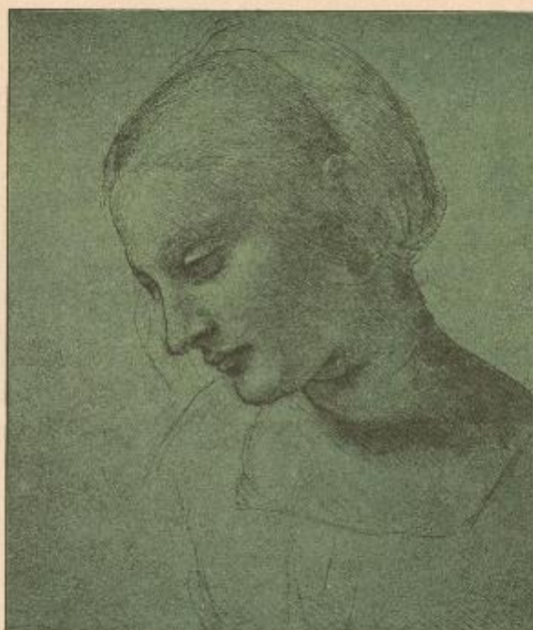
496 - 31 - Essendo di Paolo Veronese, Venezia, 1600. Paris, Louvre.