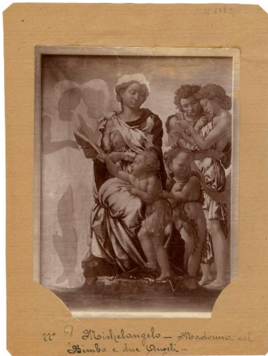
22° 9 Michelangelo - Madonna col Bambino e due Angeli.