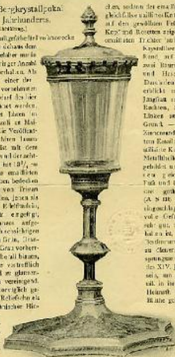
Ein literar. Bergkristallpokal im Museum Petli-Pezani.

(ist Abbildung) Bergkristallgefäß mit in der Mitte hoher Schaum dem Mittelalter mehr gebräuchlich als erhalten. Als einer der vornehmsten auf der hier abgebildete bezeichnet werden, den ich vor nicht langer im Museum Petli-Pezani in Mail- land erwarb, und für die Veröffent- lichung photographiren lassen durfte. Derselbe hat mit dem Deckel B und sich von der acht- seitigen Basis (siehe Fig. 107), im Durchmesser. Die am meisten Seiten, die denselben bedecken und die Legende von Trism und Isidore darstellen, jenen als Ritter, diese als Heiligschüler, sind nicht unecht, erhebt, sondern als Ganzes auf- geschoben in der ursprünglichen Farbe, bei denen Grün, Braun- ge, Violett, Gold, Grau vorherr- schen, was dem Metall hübsch, quadratischen Grunde vorzüglich sich abhebt und an glänzen- der Wirkung sich vereinigt. Die Figuren sind vorzüglich ge- zeichnet und der Reliefcharakter besonders in technischer Hin- sicht, den Ab- schnitt der Kar- niesenpartien noch an der Ver- goldung fest- haltend. — Aus dem Hufe wächst an a. Hochgrad malteser Zaischmittel, das mit Goldstreifen, in dem die orph reber Bildh.