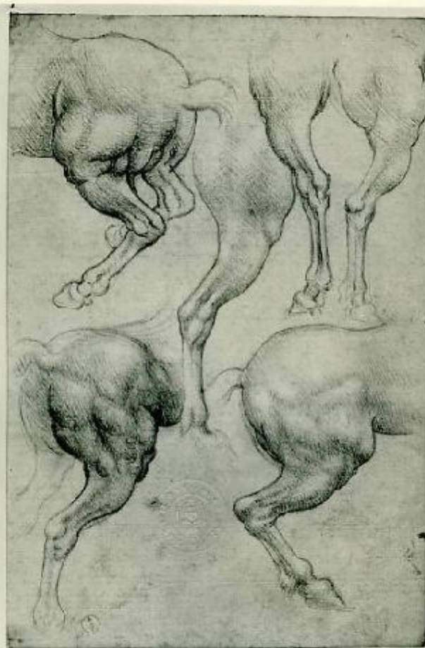
6847 - TORINO - Studio - Leonardo da Vinci - Palazzo Reale - ANTONIO. ROMA