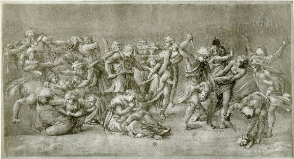
17221 - TORINO - Strage degli innocenti - Giulio Romano - Palazzo Reale