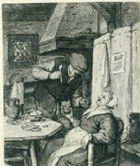
1855 - TORINO - Scene di contadini - Adriano Van Ostade - Palazzo Reale - Adriano, 1855