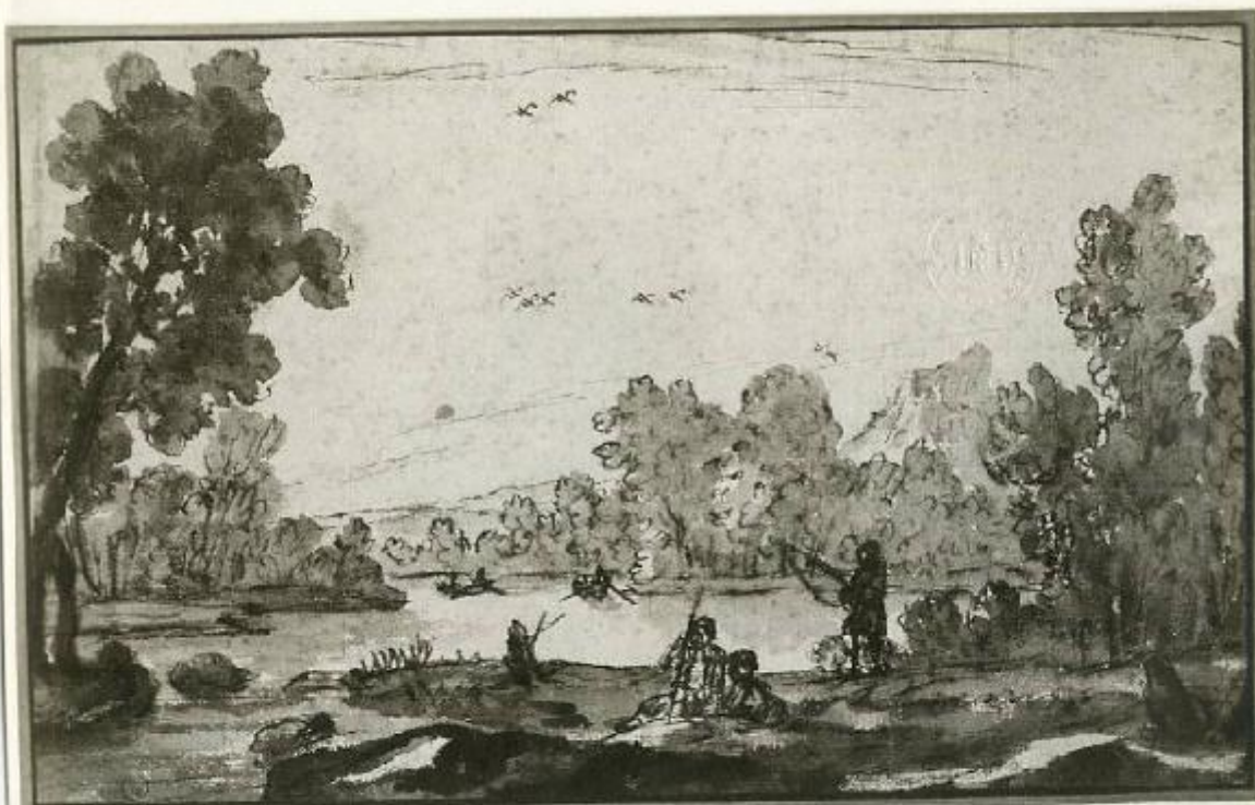
17230 - TORINO - Schizzo di un paesaggio - Claudio de Lorenna - Palazzo Reale - Ancorson Roma