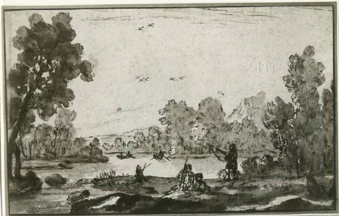
17230 - TORINO - Schizzo di un paesaggio - Claudio de Lorena - Palazzo Reale - Anderson Roma