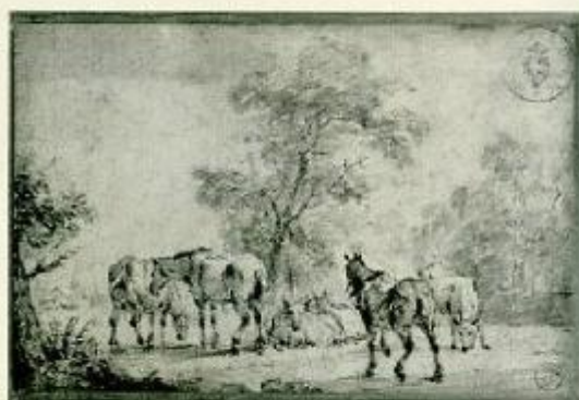
9803 - TORINO - Giobbe - Giovanni Van Enck - Studio - Adr. Van de Velde - Studio - Palazzo Reale - Antwerp, 1668