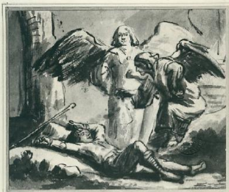
1666 TORINO Sogno di Giacobbe Rembrandt Palazzo Reale