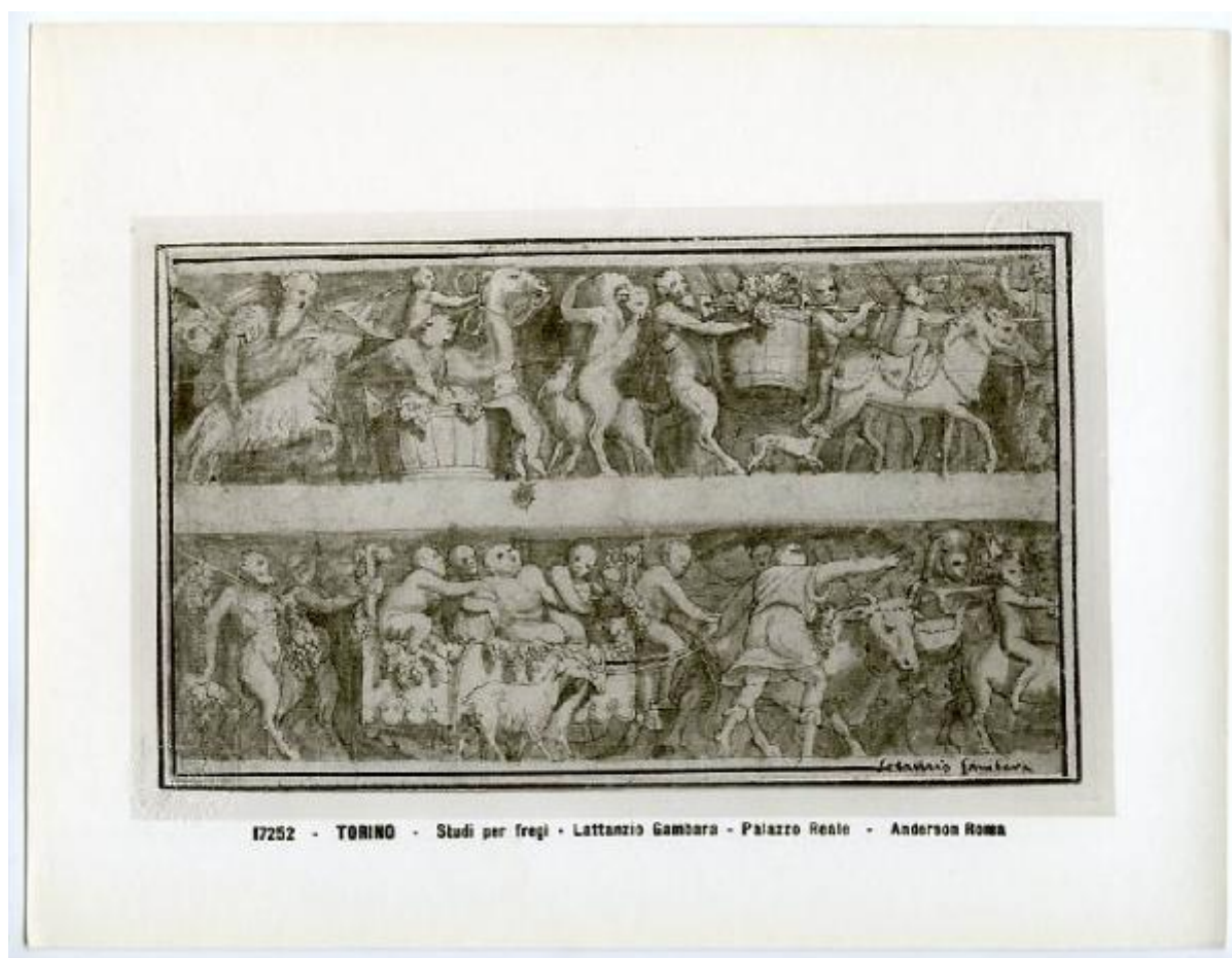
17252 - TORINO - Studi per fregi - Lattanzio Gambara - Palazzo Reale