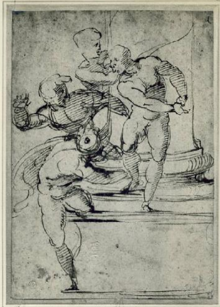
986r - TORINO - Studio - Raffaele - Palazzo Reale - Arch. Pont. Roma