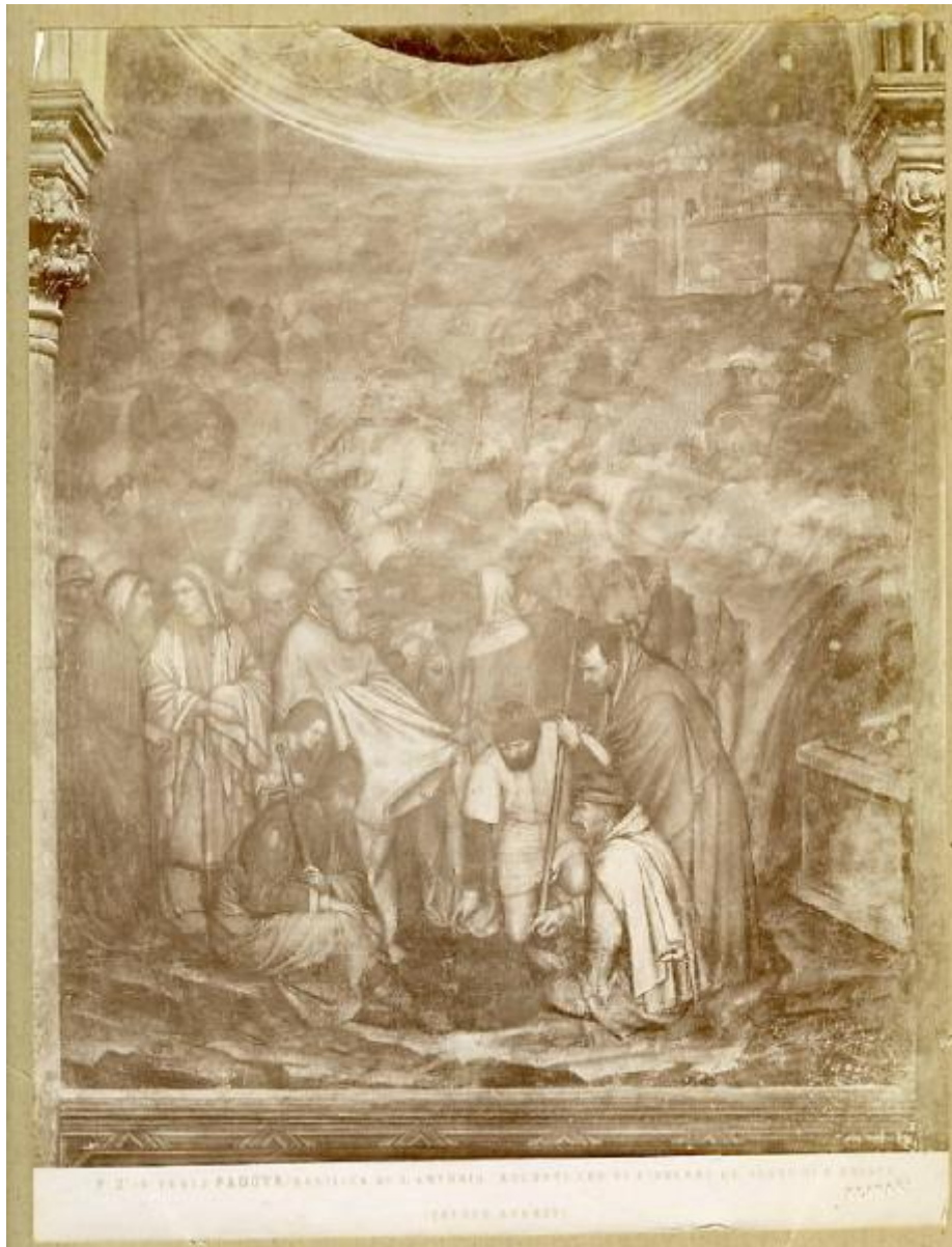
F. 2. - V. 1812. PADOVA. SANITICA DI S. ANTONIO. SOCCOPISTO DI S. VINCENZO. DI S. GIUSTINO E S. GIUSEPPE. (1812. 1813.)