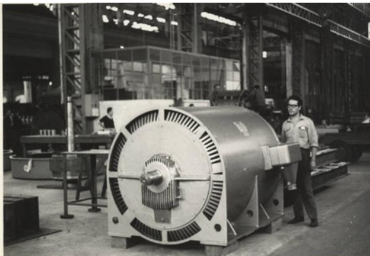
1955 - 1 Motore asincrono trifase a gabbia completamente chiuso con ventilazione esterna - 1500 HP - 6000 V - 50 Hz - 1490 giri/1' per Società Pirelli - Bicocca