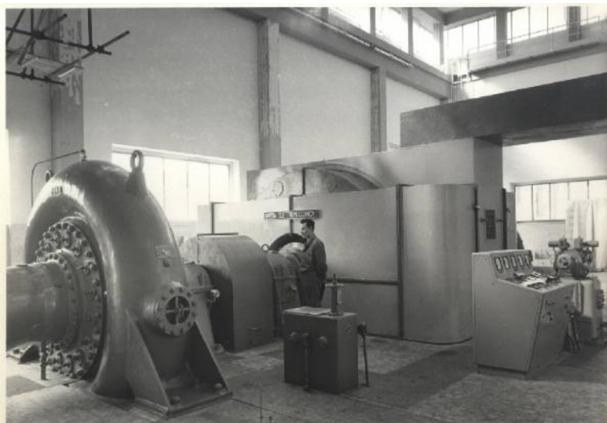
1959 - 1 Alternatore 18.000 kVA - 6.000 V. - 50 Hz - 750 giri/1' per Piemonte Centrale di Elettricità - O.le di Sanfront