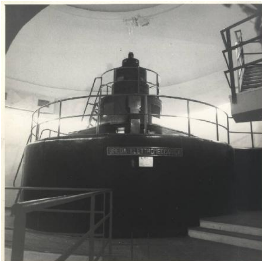
309 - 2 generatori sincroni trifasi 24.500 kVA 10,5 ± 10 kV - 50 Hz - 428,6 giri/1' per Ente Siciliano di Elettricità - Centrale di Contrasto