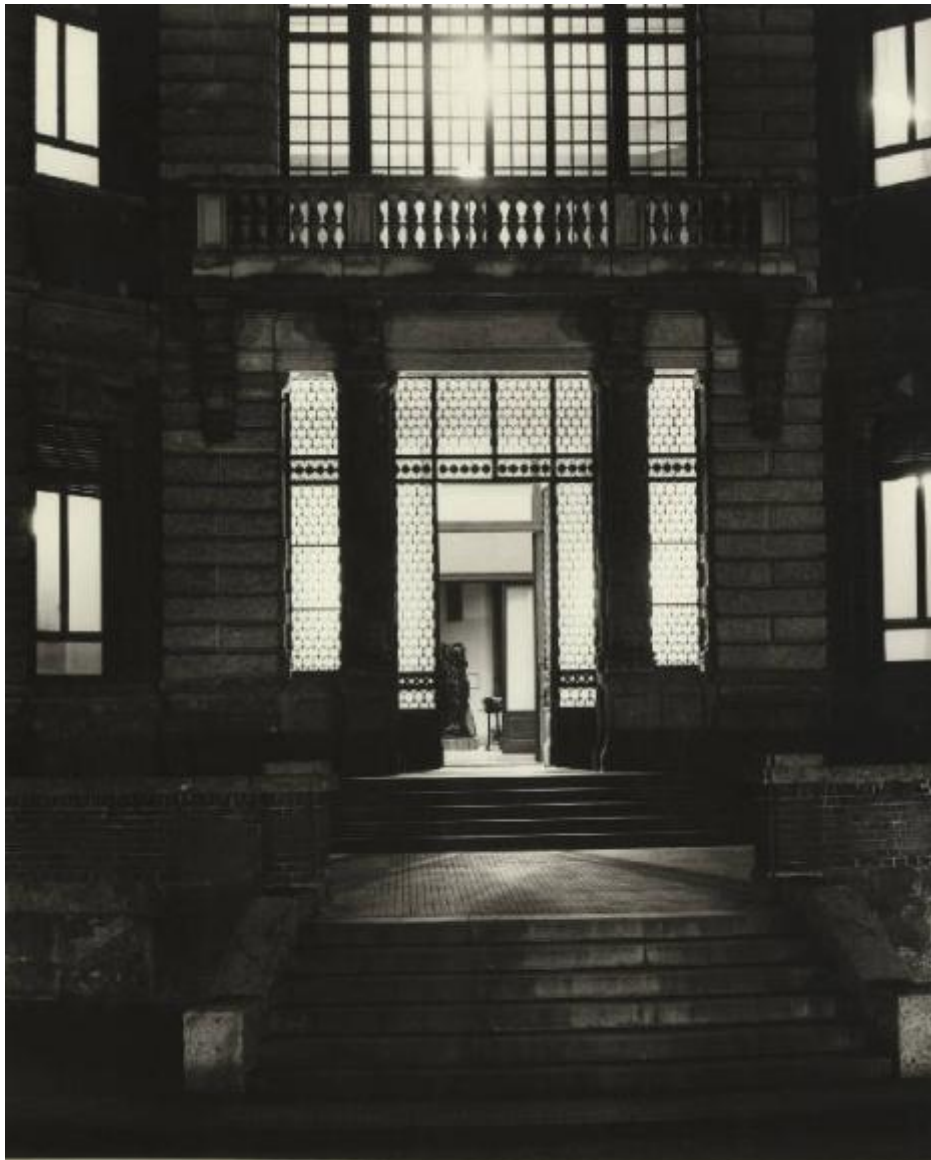
INGRESSO PRINCIPALE - MAIN ENTRANCE