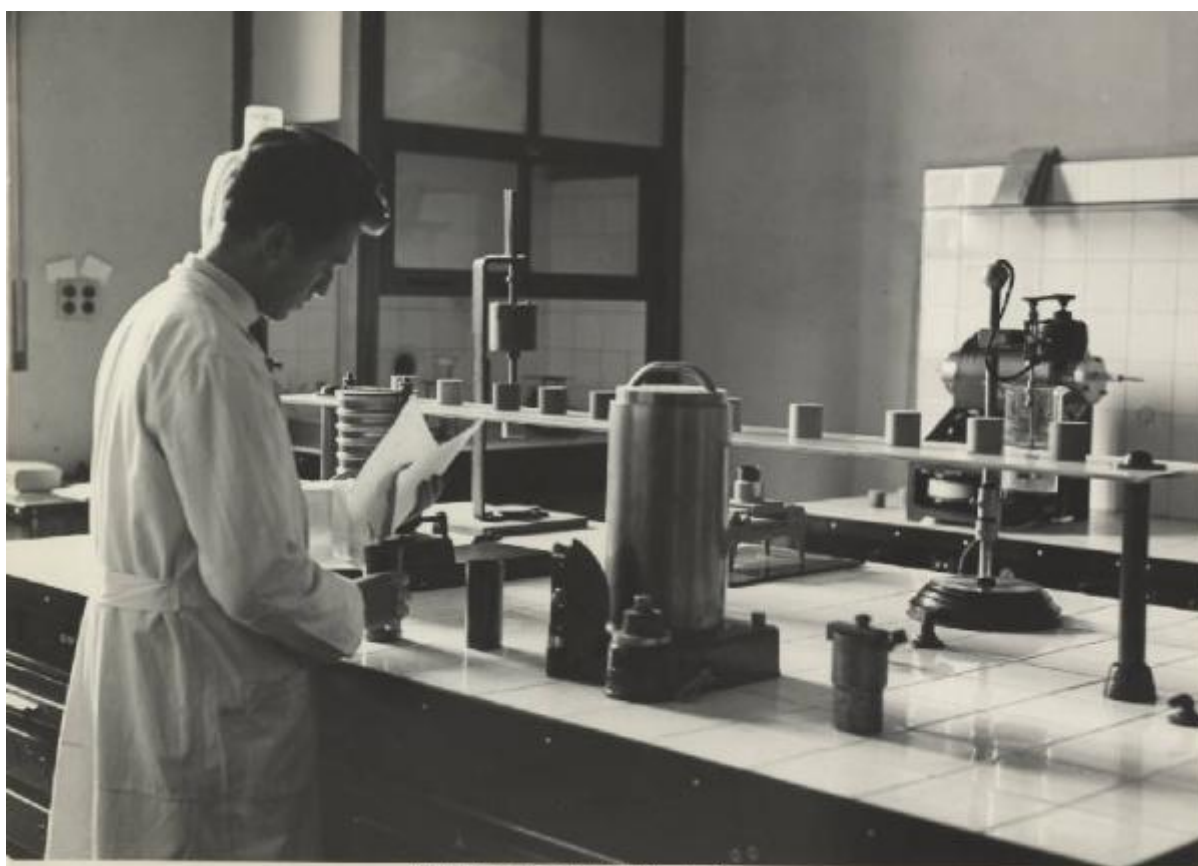
Foundry Sand Testing Room