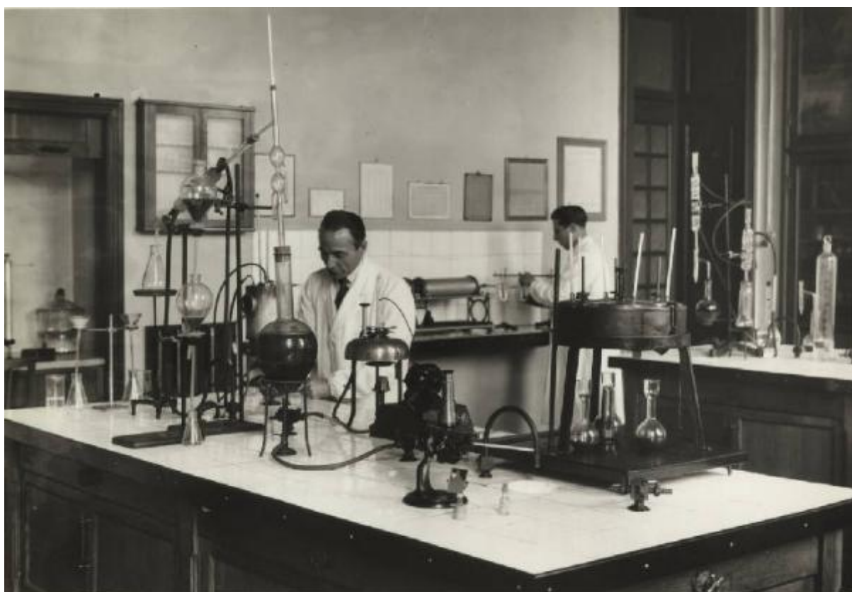
LABORATORIO OLII E COMBUSTIBILI - FUEL AND OIL LABORATORY