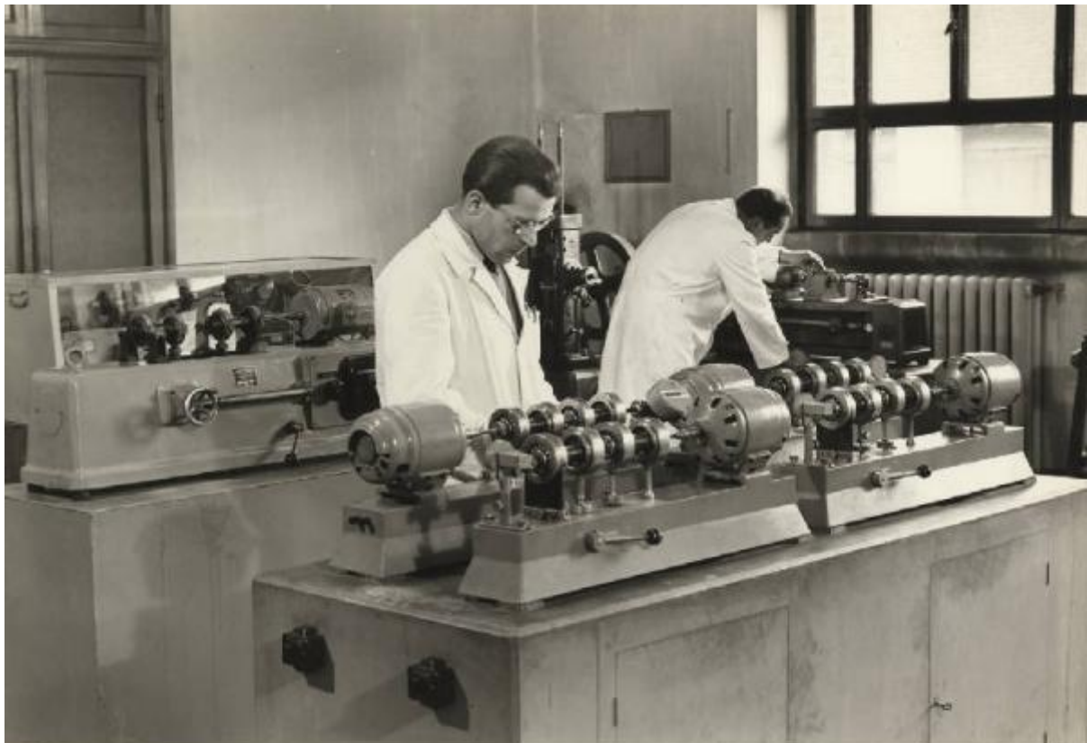
MACCHINE PER PROVE DI FATICA - FATIGUE TESTING MACHINES