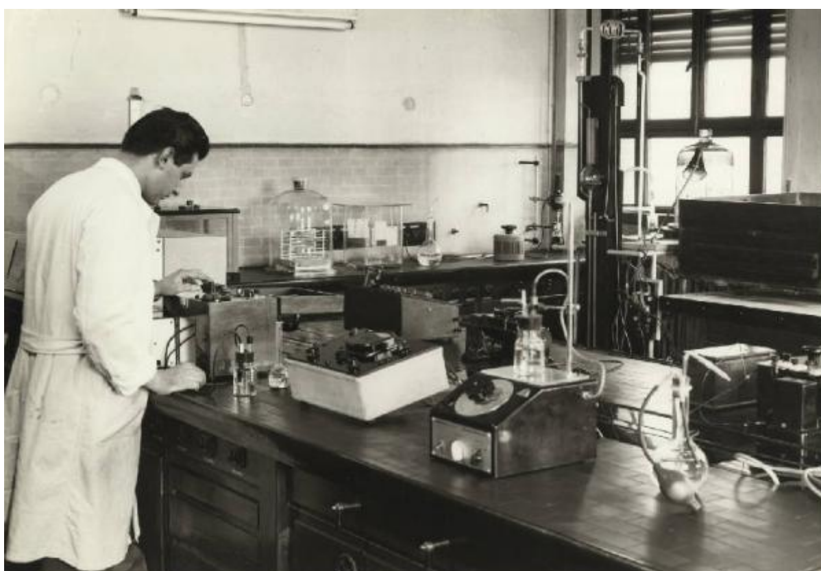
LABORATORIO ELETTROCHIMICA - ELECTROCHEMISTRY LABORATORY