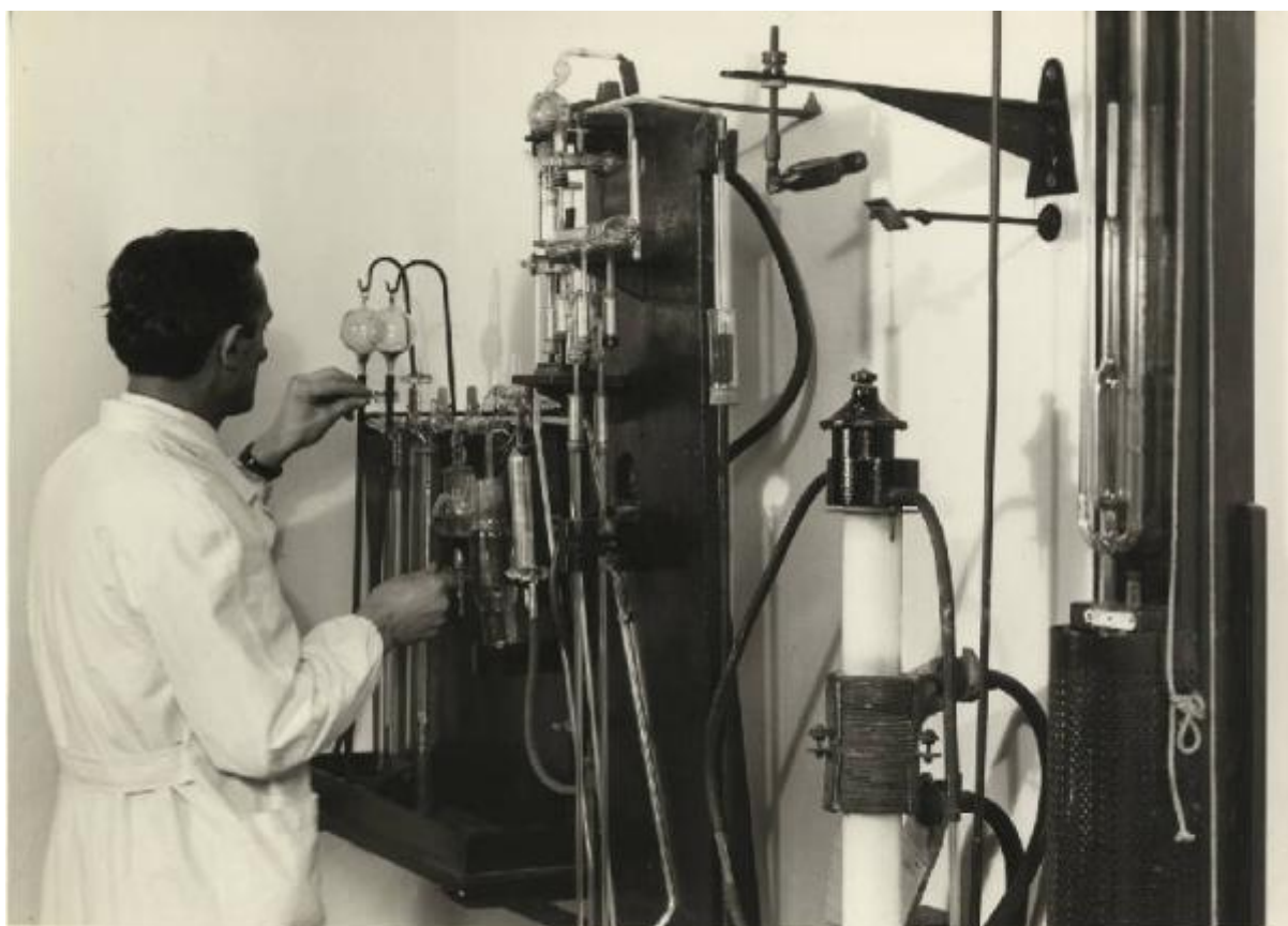
ANALIZZATORE GAS NEI METALLI - GASES IN METAL ANALYZER