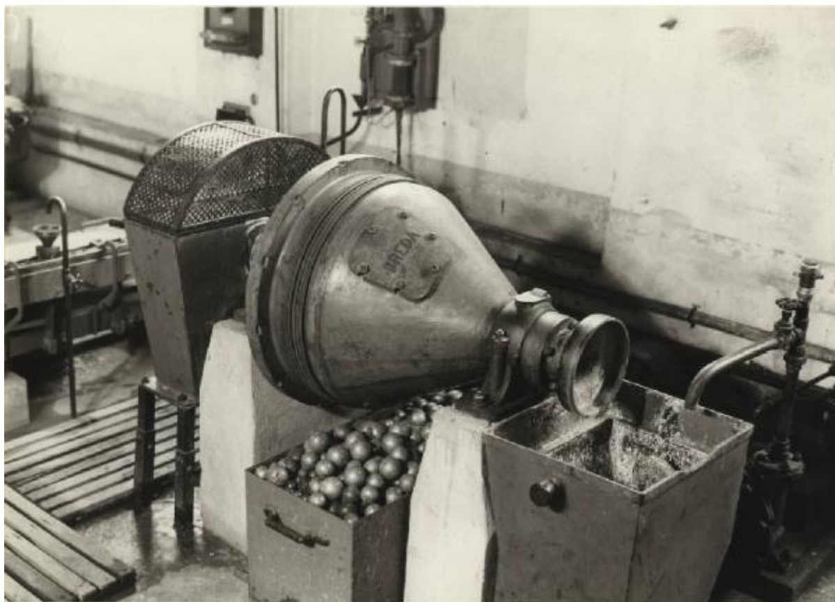
MULINO A PALLE - BALL MILL

Link risorsa: https://www.lombardiabeniculturali.it/fotografie/schede/IMM-5w060-0009490/