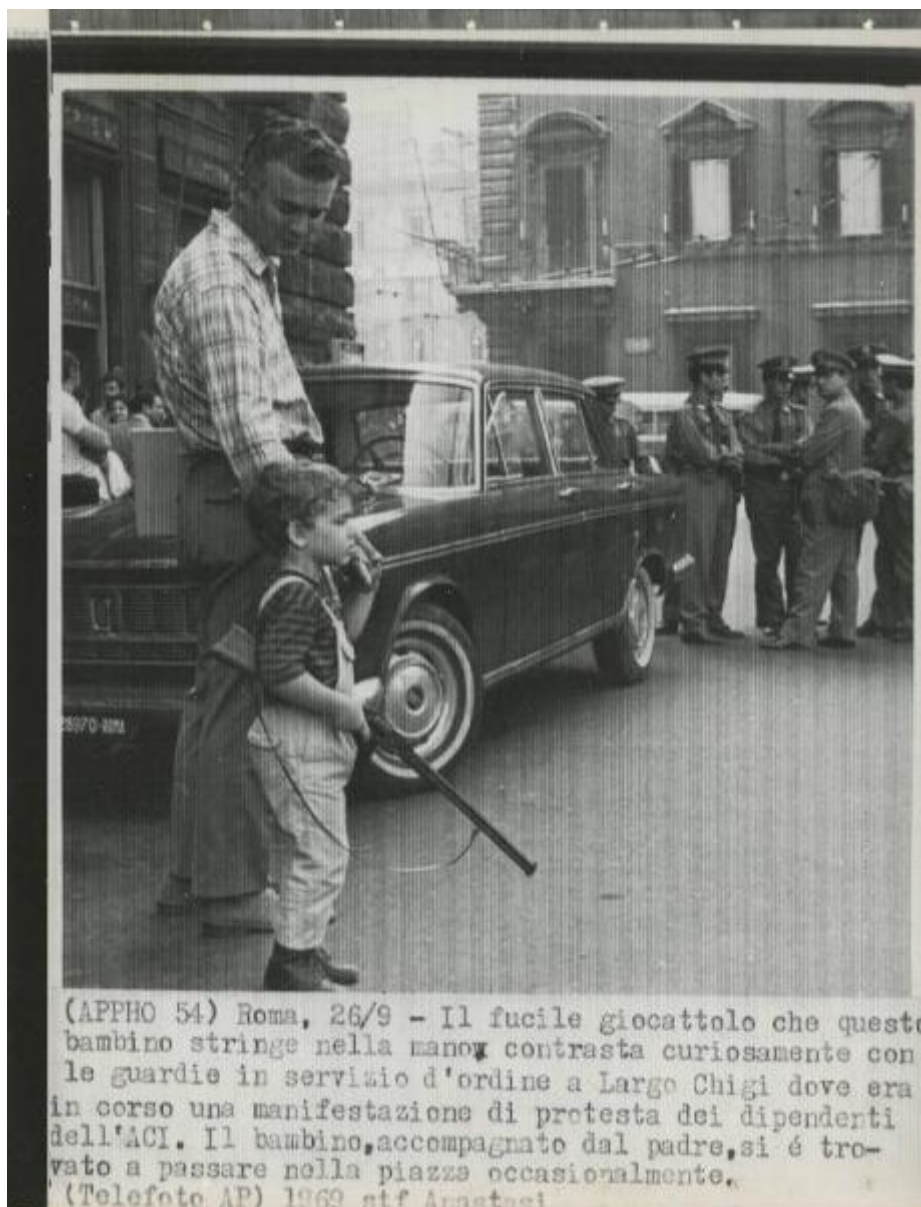
(APPHO 54) Roma, 26/9 - Il fucile giocattolo che questo bambino stringe nella mano contrasta curiosamente con le guardie in servizio d'ordine a Largo Chigi dove era in corso una manifestazione di protesta dei dipendenti dell'ACI. Il bambino, accompagnato dal padre, si è trovato a passare nella piazza occasionalmente. 1969 sif Anastasi