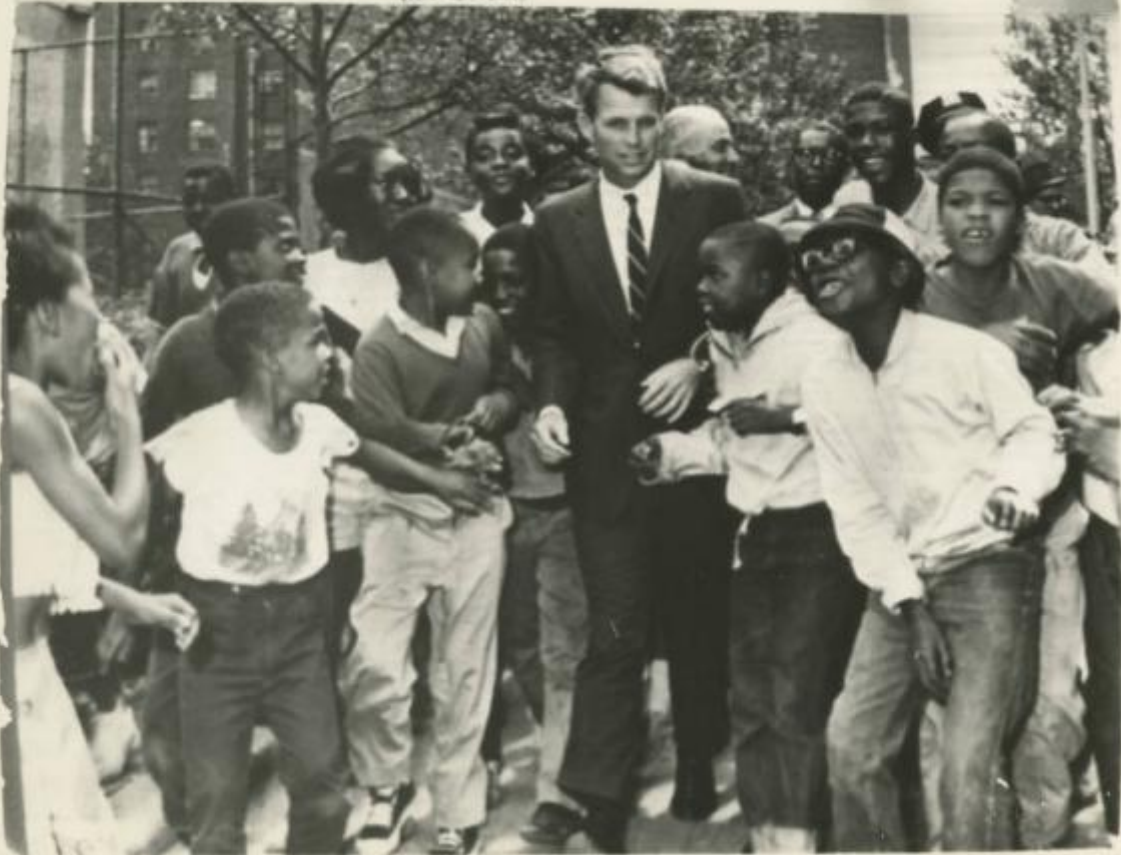
IN 162 8/16 MD: IUSA: Negro children surround U.S. Attorney-General ROBERT KENNEDY as he arrives at the Mor- ingrade Community Centre here 8/14. Robert Kennedy is chairman of the President's Committee on Delinquency and the Centre conducts a summer training remedial reading programme for children in Harlem. (NYF 1390512)