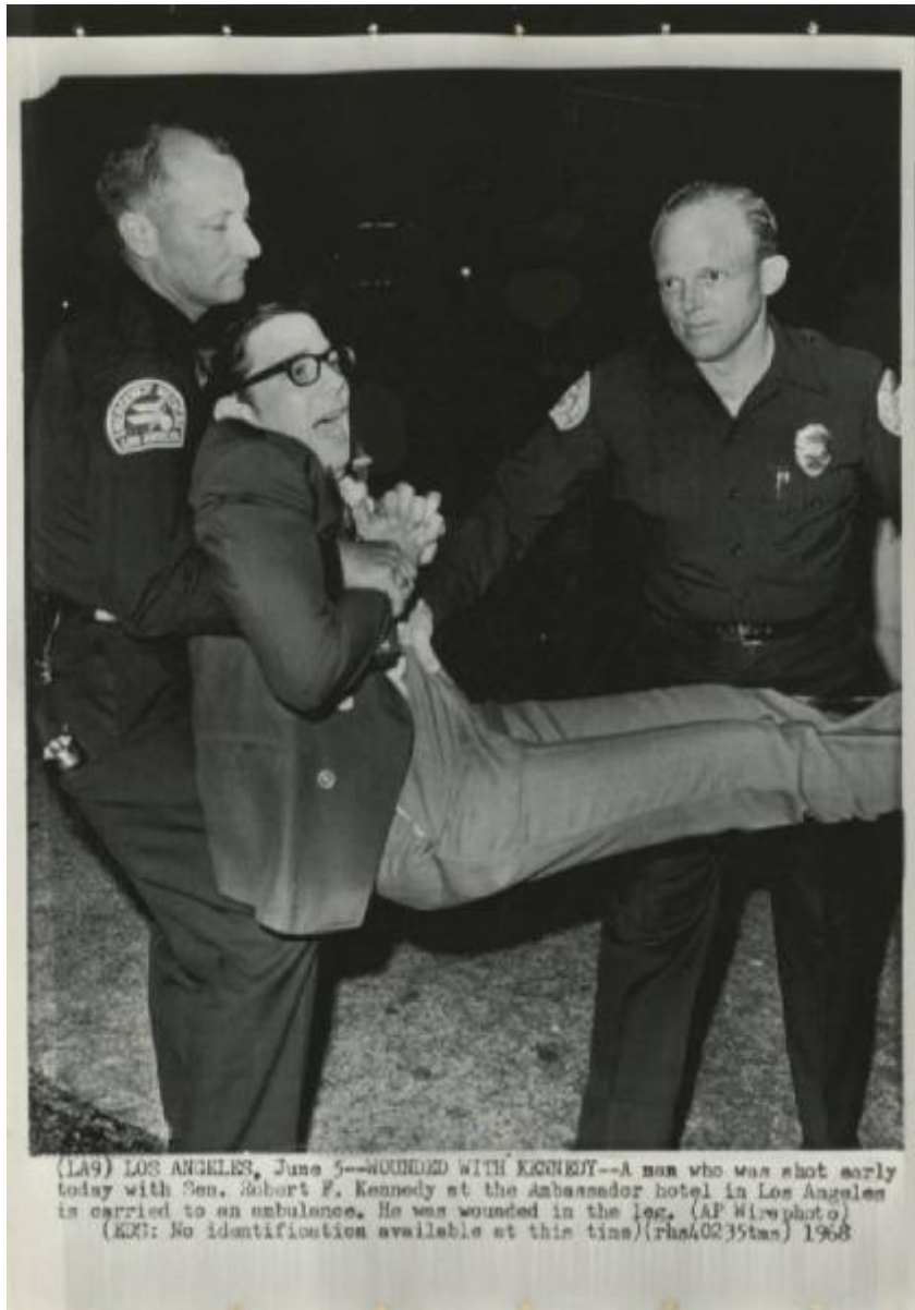
(LA9) LOS ANGELES, June 5--WOUNDED WITH KENNEDY--A man who was shot early today with Sen. Robert F. Kennedy at the Ambassador hotel in Los Angeles is carried to an ambulance. He was wounded in the leg. (EOR: No identification available at this time)(Rhs40235tas) 1968