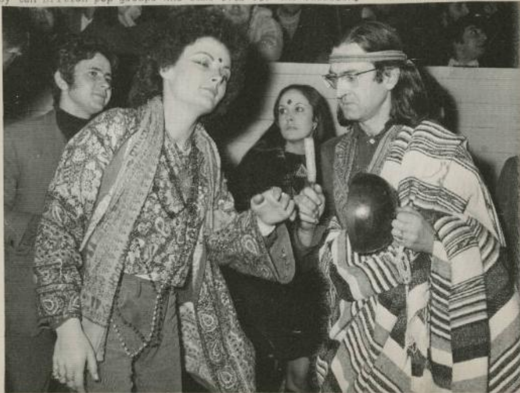
PR 290/MAY 18, 1967/PARIS - "Wrapped in coloured djellaba and sporting the new traditional flowered skirts, two "Hippies" grand priests dance during the II/I7 first "Paris' Psychedelic show" at the Sports Palace. That "Hippie Night" was entertained by ten British pop groups who came over for the occasion.